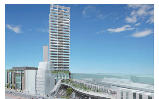
▲大泉学園駅北口再開発ビル

明年3月に27階建ての大泉学園駅北口再開発ビルが完成します。区民事務所や図書受け取り窓口ができます。また、自転車駐車場とバス・タクシー乗場もできます。さらに改札口につながる歩行者専用通路(ペデストリアンデッキ)には、練馬にちなんだアニメキャラクター等が設置されます。