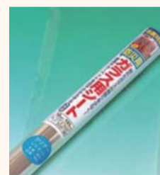
▲ガラス飛散防止フィルム