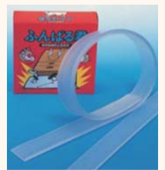
▲家具転倒防止安定板