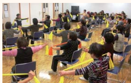
▲介護予防のロコモ体操