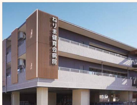
ねりま健育会病院

本年4月、区内2か所目のリハビリテーション病院となる「ねりま健育会病院」(100床)が開院。新たに、高野台運動場跡地にも回復期リハビリテーション病院を誘致してまいります。また、順天堂練馬病院を増床(90床)・3次救急医療病院として医療機能を拡充します。