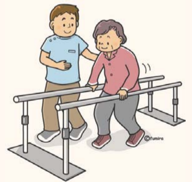
リハビリ風景(イメージ)