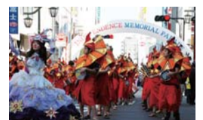
練馬まつり・記念パレード