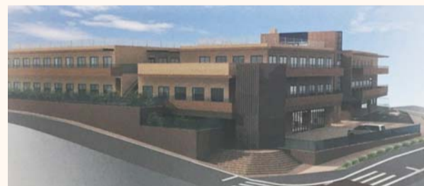
練馬の丘 キングス・ガーデン

公明党は、特別養護老人ホームを整備推進し、平成29年度に2施設(練馬2丁目、土支田2丁目)を整備します。これにより、区内施設数29か所になり都内最大となります。また、都市型軽費老人ホームを小竹町に開設します。(区内10か所目)