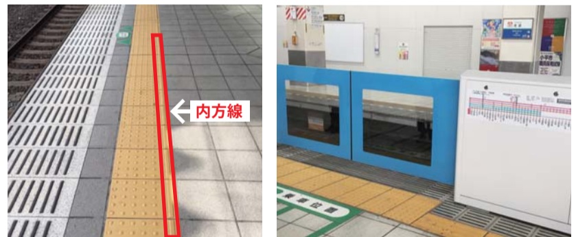
内方線付き点状ブロック

視覚障がい者のホーム転落事故を受けて、公明党は署名等を通じ予防策を強く要望。その結果、内方線付き点状ブロックが未整備の5駅(桜台駅、富士見台駅、豊島園駅、武蔵関駅、新桜台駅)への設置費用が予算化されました。また平成32年度までに、西武線・練馬駅へのホームドア設置も決まりました。